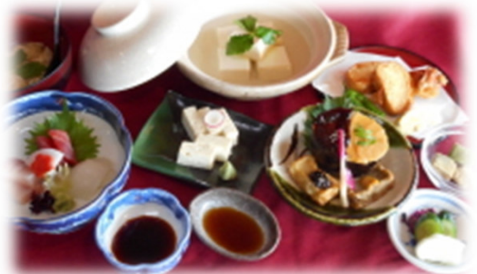
※会長にご予約頂いた先斗町『山とみ』